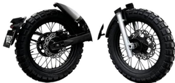
NEUMÁTICOS 50 /50