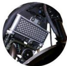
RADIADOR DE ACEITE